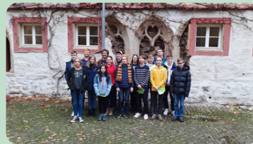
von Diana Niebergall

Auch in diesem Jahr ließen wir es uns als Förderverein nicht nehmen, der Einladung zur Siegerehrung der Matheolympiade zu folgen. Nachdem diesmal die zweite Runde (Kreisrunde) wieder zentral an der Hochschule in Eisenach stattfand, gab es einige Erfolge zu verzeichnen. Das MLG belegte zweimal den 1. Platz, zweimal den 2. Platz und dreimal den 3. Platz. Die herausragenden Leistungen der Schüler wurden gewürdigt und mit Eisenach Gutscheinen ausgezeichnet. Ebenso wurde die Teilnahme aller mit Gutscheinen für die Cafeteria belohnt. Die Mathematiklehrer sowie Herr Giesa waren besonders stolz auf die sehr guten Leistungen ihrer „Schützlinge“. Wir halten für die nächste Runde alle Daumen gedrückt.